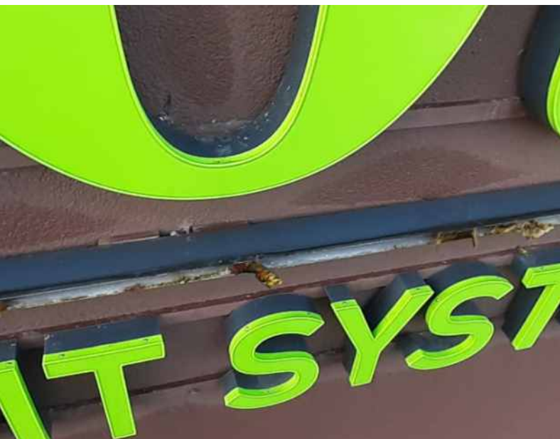
Moosbildung an Bauteilen der Werbeanlage