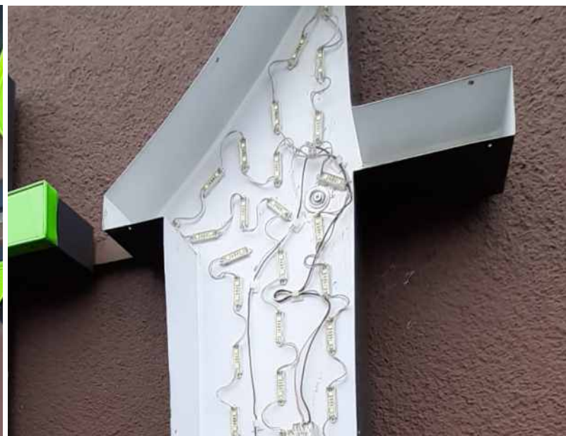
Gereinigter Buchstabenkörper mit neuer Strahlkraft