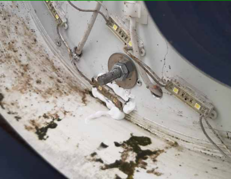
Schmutzansammlung im Buchstabenkörper